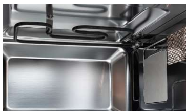
Grill de resistencia